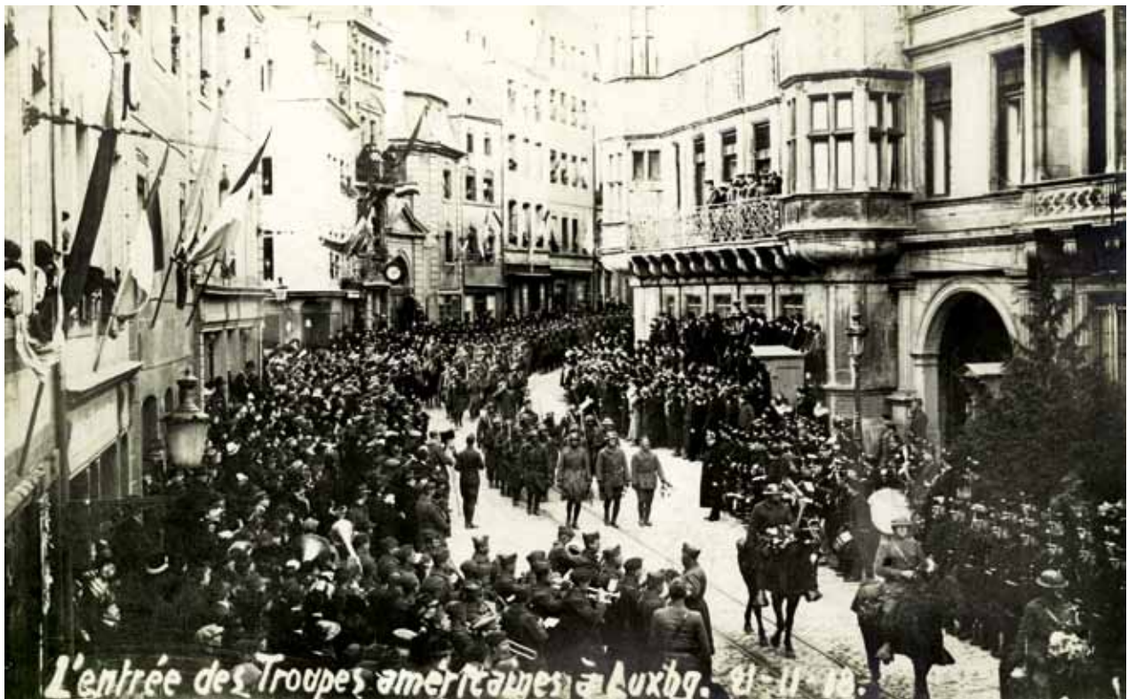
Entrée des Troupes américaines à Luxembourg

Sehr beliebt waren Sportveranstaltungen, wie z.B. Boxen, Fußball, Rugby, Leichtathletik oder Baseball. Es wurden aber auch Theatervorstellungen, Wanderkinos, Open-Air Shows und Wettkämpfe organisiert. Das größte Interesse der Einheimischen galt den Vorführungen von Kriegsausrüstung; von Artillerie, Traktoren, Motorräder, erbeuteten deutschen Waffen bis hin zu Flugzeugen und Panzerkampfwagen gab es manches zu entdecken. Auch Pferderennen und das typisch amerikanische Thanksgiving spielten eine wichtige Rolle. Andererseits war die „ Sprangprozessioun “ in Echternach für die Amerikaner ein absolutes Muss.