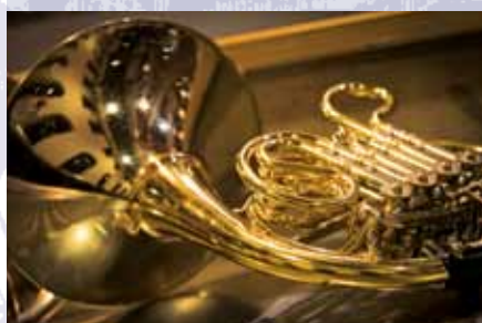
AMAM-BENEFIZCONCERT MAT DER MILITÄRMUSIK 23