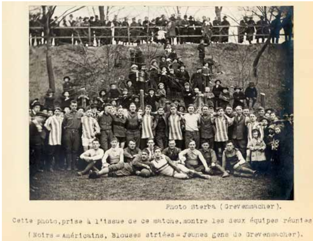
Les Américains à Grevenmacher – jeu de football, janvier 1919.

Doch trotz den allgemein guten Beziehungen entstanden auch Konfliktsituationen. Beispielsweise wegen dem „Preiswucher“. Einige luxemburgische Händler oder Verkaufsleute profitierten von den U.S.-Soldaten, indem sie unverschämte Preise berechneten. Doch auch Diebstahl blieb nicht aus. Besonders auf die amerikanischen Lagerhäuser hatte man es abgesehen. Außerdem gab es von November 1918 bis zum Frühjahr 1919 vermehrt Autounfälle, wofür die überfüllten sowie schlechten Straßen verantwortlich waren. Auch die Spanische Grippe, welche im Frühjahr 1918 in Europa auftrat, sollte vor Luxemburg nicht haltmachen. Man geht davon aus, dass sie mehr Menschen davonraffte als der Erste Weltkrieg selbst.