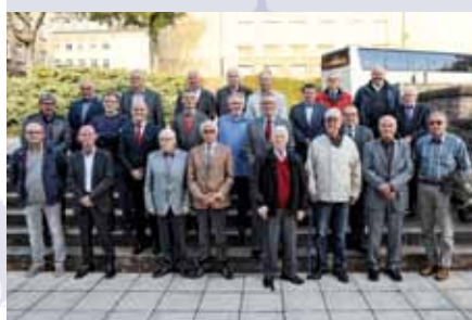
KONVENIAT VUN DEN PENSIONNÉIERTEN ËNNEROFFIZÉIER 15