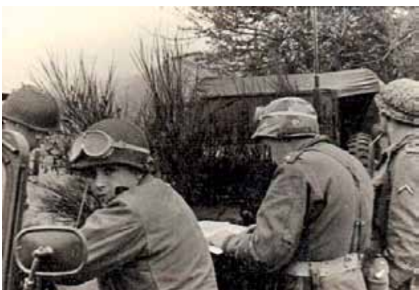
Manöver Baumholder 1967