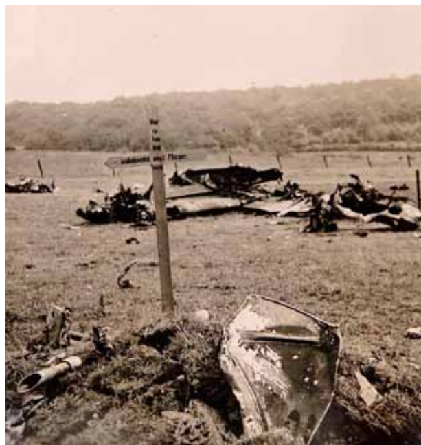
Das provisorisch angelegte Feldgrab für die Besatzung von P/O LAWS. Auf dem Holzkreuz steht: „Hier ruhen drei unbekannte englische Flieger 10.5.40“.