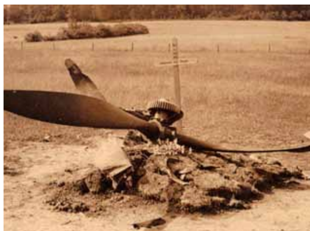
Später wurde der drei Blatt Propeller der Fairey Battle hinzugelegt.