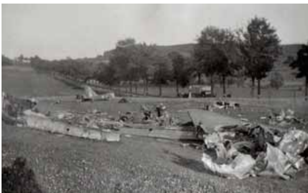
Dieses Foto zeigt die komplette Absturzstelle längs der alten Straße von Athus nach Linger. Auf der Straße ist ein deutscher Lastwagen zu sehen. Beim Heck des Flugzeuges sind eine Frau mit einem Kind die sich den Ort der Tragödie ansehen zu erkennen.