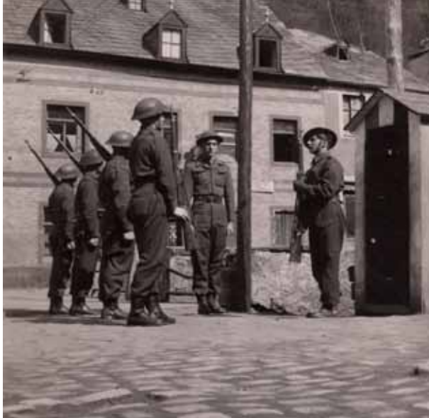
Wuechtofléisung an der Neuerburg. Als Bewaffnung droen d'Zaldoten dat Ross-Enfield N° 3 MK I. (MNHM K337_93)

Anersäits sollten se awer och bei der „Entnazifikatioun“ mathëllefen, andeems sech sollten op d'Sich no eemolege „Gielemännercher“ man.