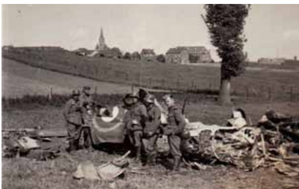
Das erst kürzlich aufgefundene Foto zeigt die Überreste der Fairey Battle von P/O LAWS vom 142nd Sqn. Im Hintergrund ist die Kirche von Lamadelaine zu sehen. Heute ist die Umgebung fast komplett verbaut.