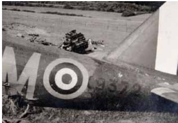
Auf diesem Foto erkennt man einen Teil vom Squadron Code PM sowie die Seriennummer des Flugzeuges K-9372. Im Hintergrund liegt der herausgerissene Zwölfzylinder Rolls Royce Merlin Motor der Maschine.