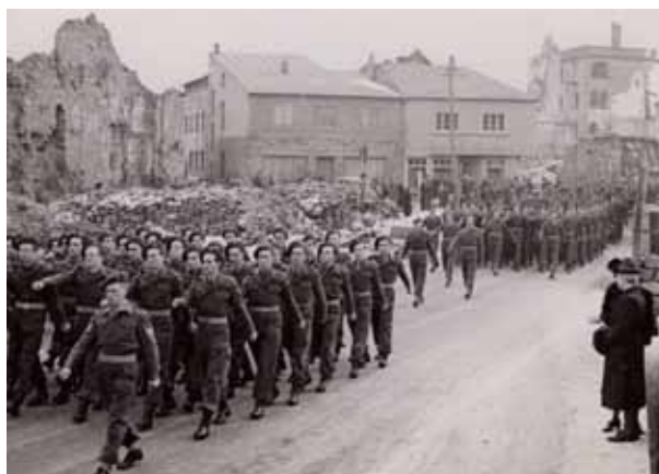
Dat 2. Infanterie-Bataillon defiléiert um Wee fir an Sonndesmass duerch déi zerstéiert Stroossen Bitburgs.

Nom Krich war Däitschland an déi 4 bekannte Besatzungszonen opgedeelt ginn an och d'lëtzebuergesch Regierung wollte „StéckvumKuch“. Sou huetseden 22. Januar 1945 bei der European Advisory Commission ugefrot fir seng eemoleg Territoiren, déi et 1815 un „Preußen“ huet missten oftrieden, als „réparations de guerre“ ze besetzen. Et gouf awer eng Ofso an d'Regierung huet sech dunn un d'Fransousen adresséiert, fir mat der franséischer Arméi zesummen eng méi kleng „zone d'occupation“ ze verwalten. Den 20. Oktober 1945 ass schlussendlech en Accord fonnt ginn, wou d'Lëtz. Arméi mat 2 Bataillouner (1.200 Mann) sollt Dealer vum Kreis Bitburg an Kreis Saarburg occupéieren.