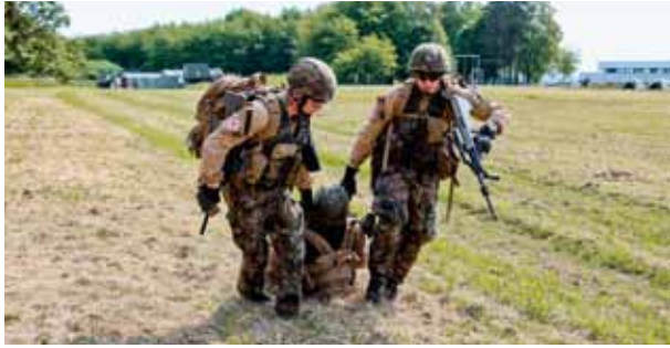
Des militaires luxembourgeois pourraient prochainement renforcer le soutien médical de l'EUTM Mali

catastrophe etc.). Cette nouvelle entité militaire serait reliée au CHEM par un tunnel souterrain. Pour le ministre François Bausch, le scénario optimal serait d'adopter le projet de loi de financement avant l'été 2023 afin que la construction de cette nouvelle entité soit achevée en 2028. Les coûts de sa construction devront faire partie des dépenses de Défense du Luxembourg.