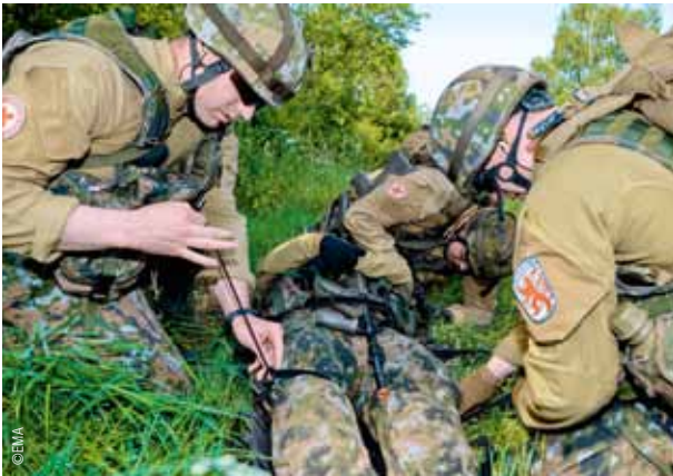
Stabilisation d'un blessé avant son évacuation du terrain