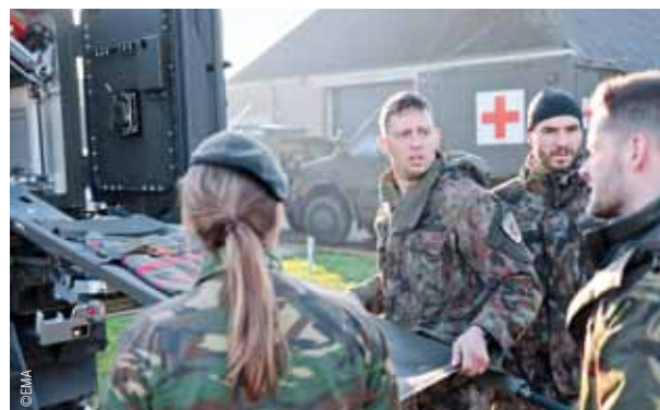
Des militaires luxembourgeois lors d'un exercice à Marnewaard en décembre 2019