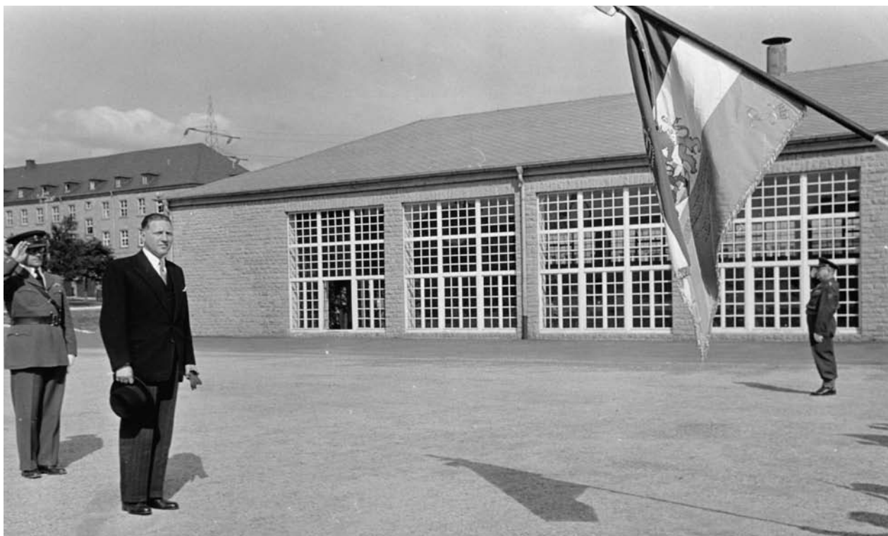
Den Arméiminister Pierre Werner bei der Abschiedszeremonie zu Bitburg

Et ass net fir d'éischt an onser Geschicht, dass Diekerech Garnisounsstaad ass. Et ass een vun deene villen Exemp-