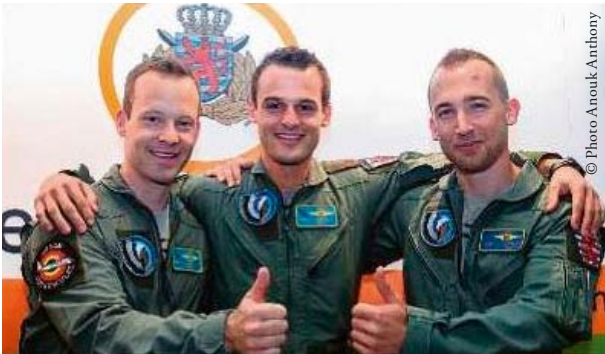
Die künftigen A400M-Piloten: